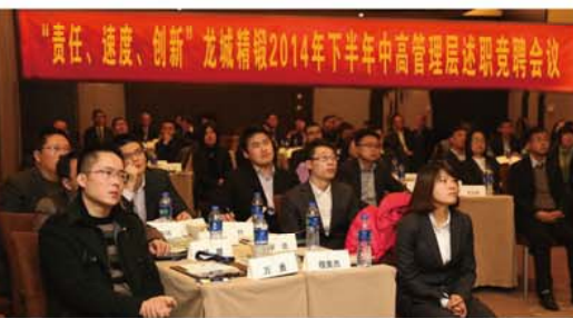
“责任、速度、创新” 龙城精锻2014年下半年中高层管理述职竞聘会议

一步提升部门的整体管理水平,同时给员工搭建一个施展才华的平台,创造参与平等竞争的成长机遇和环境,在公司领导的指导下,由人力资源部组织对行政部副经理、人力资源部副经理等岗位进行内部公开招聘。