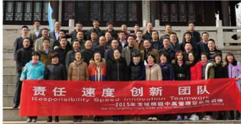
责任 速度 创新 团队 Responsibility Speed Innovation Team 2015年龙城精锻中高层管理述职竞聘会议

1月17日,结束了一天的2014年下半年中高层管理述职竞聘会议,根据日程安排,公司组织开展了中高层管理拓展拓展训练活动。拓展训练在苏州山塘景区进行,本次拓展训练的主题项目为《梦想过山车》,以“责任、速度、创新、团队”为主题,活动从上午八点半起至中午12点半结束,各队员用饱满的热情,积极的思考,接受项目的挑战,使得本次拓展训练得以圆满完成。