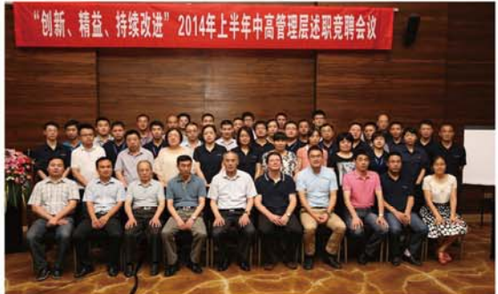
“创新、精益、持续改进”2014上半年中高层管理述职竞聘会议

2014年7月12-13日,江苏龙城精锻有限公司2014上半年度中高层管理述职竞聘会议在无锡灵山元一希尔顿逸林酒店圆满举行。2014上半年通过公司全体员工共同努力,截止6月30日,精锻瓜板及汽车发电机转子产量达到2848.4万件,同比增长22.96%;销量2838.76万件,同比增长20.67%;实现销售额6.24亿元,同比增长26.06%。