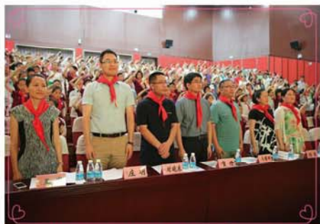
5月30日下午,武进区机关幼儿园六一表彰大会暨六一活动在悠扬的旋律中拉开了帷幕。