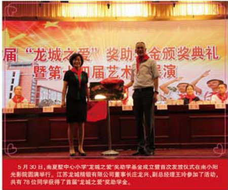
5月30日,南夏墅中心小学“龙城之爱”奖助学金颁发暨首次启动仪式在南小阳光影院圆满举行。