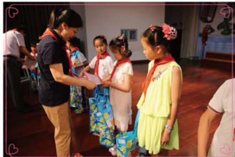
5月29日,武进区机关幼儿园举行了六一儿童汇报表演暨“龙城精锻关爱教育百万光彩基金”颁奖仪式。