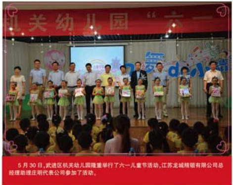
5月30日,武进区机关幼儿园隆重举行六一儿童汇报表演暨“龙城精锻关爱教育百万光彩基金”颁奖仪式。