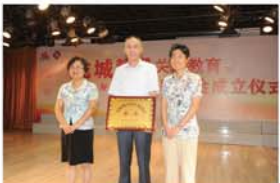
2014年6月16日上午,“湖塘中心小学”龙城精锻杯“魅力新秀”暨龙城精锻关爱教育百万光彩基金成立仪式在常州市武进区湖塘中心小学举行。