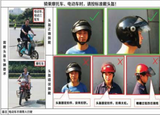
备注:电动车不得载人行驶

员工们都知道公司从2013年中开始陆续推行各项“安全保命条例”,但“安全保命条例”是什么意思,为什么要花那么多人力、物力、精力来推行这些条例,“安全保命条例”对我公司安全管理提升有什么帮助等问题,可能有些员工都不明白,在这里我就针对这些问题为大家做解答。 “安全保命条例”也被称为“不可违背的安全规则”,此概念首先是由美国杜邦公司提出的,大家都知道杜邦公司以安全闻名世界,可以说世界上最安全的地方就在杜邦公司,国内很多企业和单位都向杜邦公司学习先进的安全管理理念和经验,而“安全保命条例”则是杜邦公司在任何情况下都不能违背的,一旦有员工违反并被证明属实的话,就会因此丢掉工作,也正因此受到相当严厉,被他的员工称为“十大天条”,杜邦公司的原则是:如果你不能保证遵守这样的“天条”,我们宁可不要你在哪里工作。龙城精锻也是借鉴了这样一个理念,我们不想员工受到伤害,对于那些可能造成严重伤害的违规行为,不是我们不给员工机会,而是机会不会给